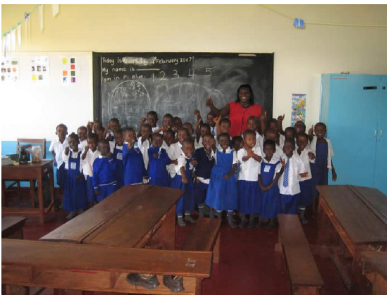
Groep 3 van de Naranbhai lagere school

Het regenseizoen is nu net begonnen, dus het land wordt weer 'plantklaar' gemaakt.